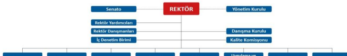
Tablo 9.1 Üniversite Organizasyon Şeması

9.1.1 Programın, bölüm, fakülte ve üniversite üst yönetimiyle yönetsel ilişkisini organizasyon şeması da kullanarak açıklayınız. Fakülte dekanının ve dekan yardımcılarının ve fakültenin üniversite içerisindeki yerini gösteren bir organizasyon şeması hazırlayınız ve şemayı Organizasyon Şeması olarak adlandırınız. Şemada fakültenin bağlı olduğu kişilerin unvanlarını belirtiniz (akademik işlerden sorumlu rektör yardımcısı, dekan gibi).